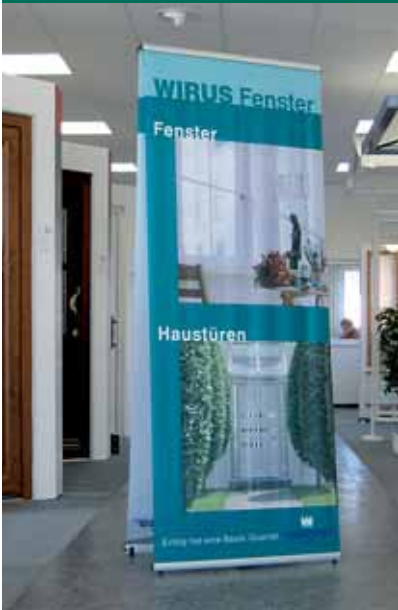
Easy Display doppelseitig