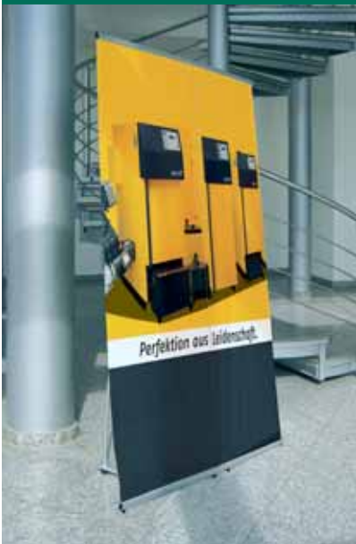
Easy Displays mit Verbinder kombiniert